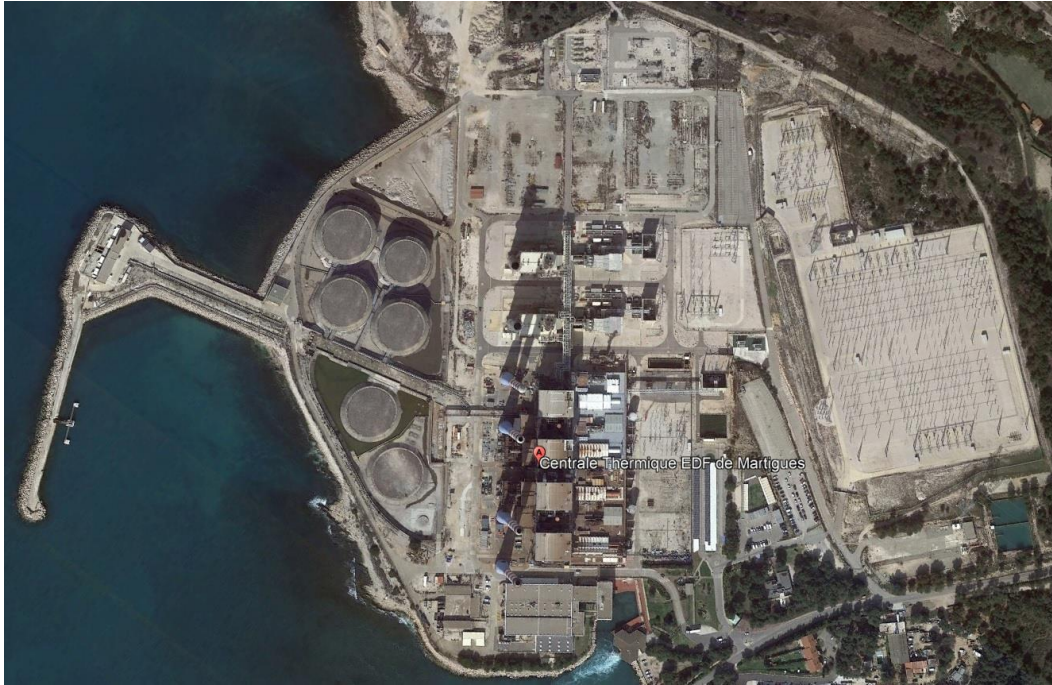
Cuves du site toutes démantelées

Les actions menées sur la nidification en 2019 avaient pour objectifs d'installer durablement chez les goélands une crainte envers l'humain et de leur rappeler le risque de ne pouvoir mener à bien leur unique reproduction annuelle.