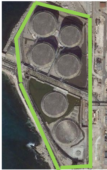
Secteur de désherbage et d'enlèvement des arbustes

Suite au renouvellement de l'Arrêté Préfectoral 2019 – Il avait été prévu de pratiquer la méthodologie de gestion de nidification des goélands, autorisant la perturbation intentionnelle et l'action sur la nidification des Goélands Leucophées présents sur le site EDF LAVÉRA, le plan d'actions global a été reconduit pour l'année 2019.