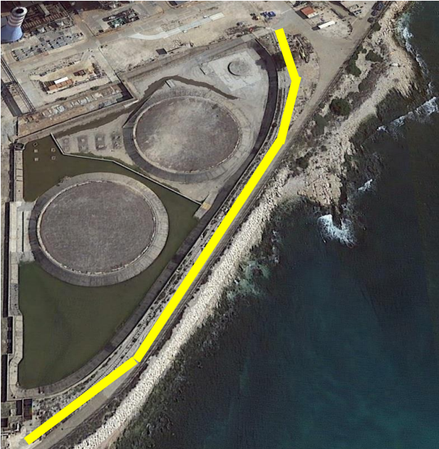
Zone de désherbage effectué avant la nidification

Plusieurs facteurs essentiels ont contribué à modifier une grande partie de nos actions, suite au confinement.